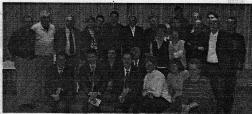
Zajednička slika sudionika susreta hrvatskih katoličkih mislija iz Augsburga, Nürnberga, Rosenhelma i Münchena

NÜRNBERG 2. SUSRET MISIJSKIH DJELATNIKA HRVATSKIH KATOLIČKIH MISIJA U BAVARSKOJ