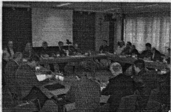
Drugi radni sastanak misijskih djelatnika u Nürnbergu

Danas se ta ploča darovatelja nalazi u hrvatskom poslanstvu, ali na nevidljivom mjestu. Nakon svih rasprava vijećnici su se složili skupa sa svojim dušobrižnicima da ove poteškoće prenesu hrvatskom generalnom poslanstvu u Münchenu. Novi generalni poslanik RH Vladimir Duvnjak zakazao je primanje voditelja Hrvatskih katoličkih misija iz Bavorske. Slijedeći međumisijski susret održat će se za pola godine u Augsburgu.